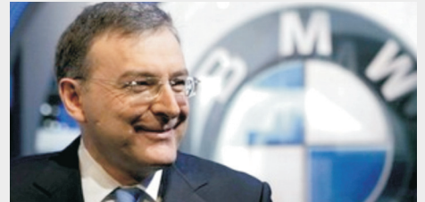
Dr.-Ing. Norbert Reithofer Vorstandsvorsitzender (CEO), BMW Group